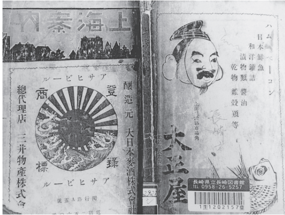
図3 『上海案内』の第一版の表紙（一九一三年刊，長崎県立図書館所蔵）