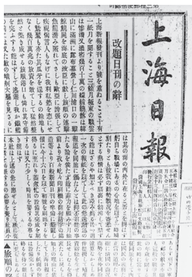
図1 『上海日報』の表紙(明治三十七年三月十六日, 東京大学, 明治新聞雑誌文庫所蔵)