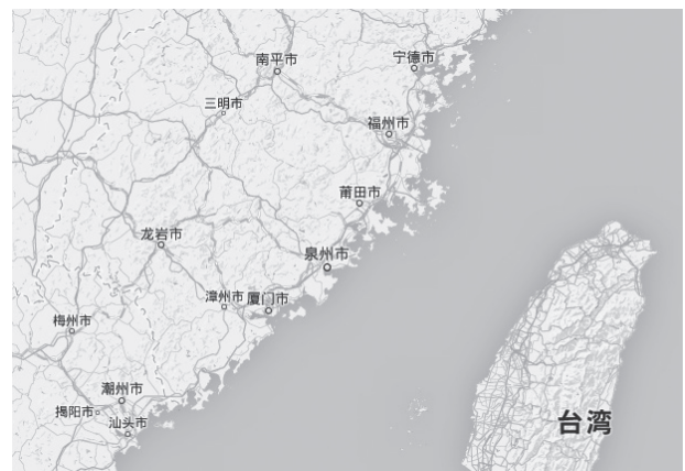
図1 汕頭市、厦門市、福州市、台湾位置関係図（Google Map）

今回、中島三千男（神奈川大学非文字資料研究センター研究員）、馬興国（神奈川大学特別招聘教授）、渡邊奈津子（神奈川大学非文字資料研究センター研究協力者）の3名で、汕頭神社、厦門神社、福州神社の調査を行った（図1）。この3つの神社は、これまで未調査で、当時の写真や資料も収集できておらず、したがって、本研究班により作成・公開されているデータベースにも掲載されていない (5) 。しかも、この3つの神社は地理的に旧中華民国の南部に建てられた神社であるというだけではなく（南部にはこの他に広東、香港の2社があるのみで、北部に