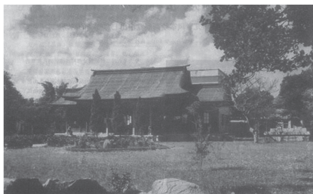
写真3 汕頭神社（文化館館報掲載）

記事やブログによれば、神社はドイツ領事館があったその場所に、1939年6月21日に日本が汕頭に進出したのち、1941年11月3日に落成したとある。戦後、1955年に汕頭市図書館となり、この図書館は文化大革命前に別の場所へ移動、文革期は「汕頭市革委会」が廃墟となった社務所に入った。文革後、新しい図書館の建設が計画され、1981年に完成したとき、神社の遺構は新しい図書館の背面に遺されていたが、1982年、図書館の拡張に伴い神社の建物は取り壊されることになった。建物跡地には子どもの読書室が建てられ、灯籠など遺構はそのとき地中に埋められたようである。2006年に図書館が新しい別の建物へ移動した後は、「旧図書館」「汕頭市文化館」となり現在に至っている。