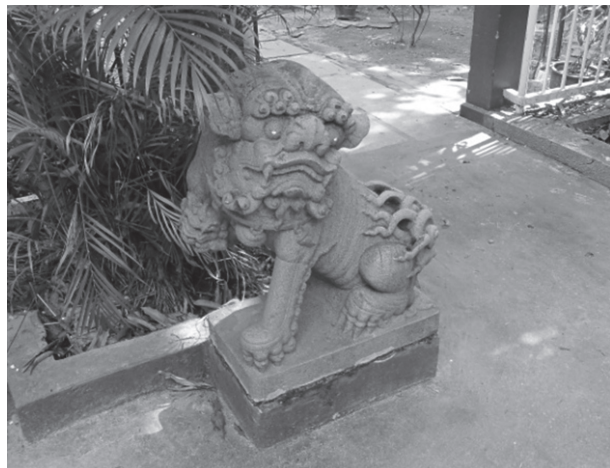
写真2 汕頭市文化館裏手にあった狛犬