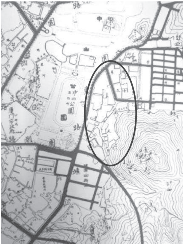
図3 1938年の厦門市地図。○で囲んだところに「蓼花溪尾」の文字が見え、山に面している

厦門市は、19世紀から「アモイ(Amoy)」の名で国際的に知られていた。福建省南部に位置する都市