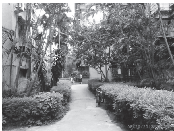
写真5 蓼花路边集合住宅地

とから、もとあった場所から移動された可能性も考えられ、この駐車場がそのまま厦門神社の跡地であるかどうかは慎重に検討してみる必要がある。