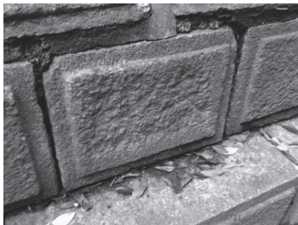
写真7 狛犬の基石。削られた跡か、うっすらと「奉獻」の文字が見える