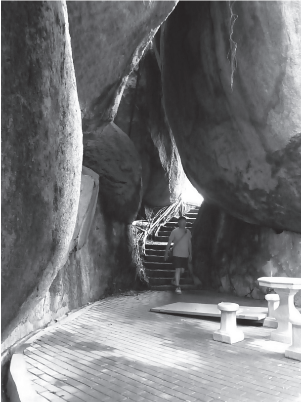
写真9 巨大な石同士の隙間から内部に入った様子