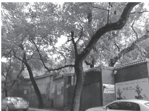
写真12 福州市倉山小学付近