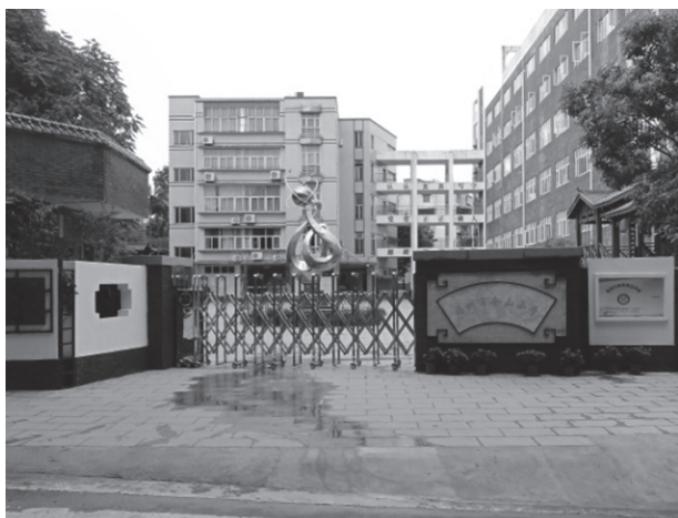
写真11 福州市倉山小学

戦前の地図から、もしかすると「日本人小学校」や「総領事館」があったのではと考えられた場所には、現在軍人の子弟が通う「福州市倉山小学」校が建てられていた。幸いにも職員の方に尋ねることができ、「日本人小学校」がその場所に存在したという証言を得られた。恐らくは、その小学校の敷地辺りに福州神社が建てられていたのだろう（写真11、12）。