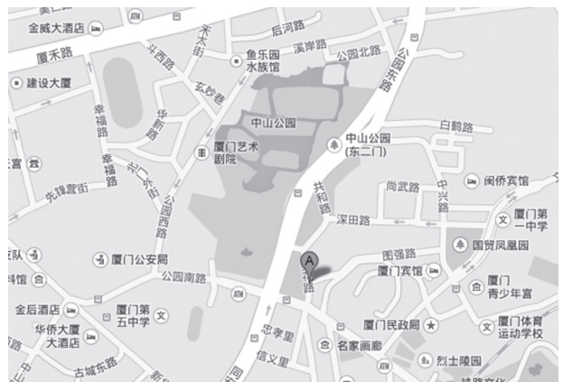
図4 厦門市思明区蓼花路辺り地図(Google Map)

まず、「蓼花路」を探し、周辺を歩き調べた。付近は木々が豊富な高台で坂が多く、「山」と呼ばれたことがある過去を想像し得る環境だった。集合住