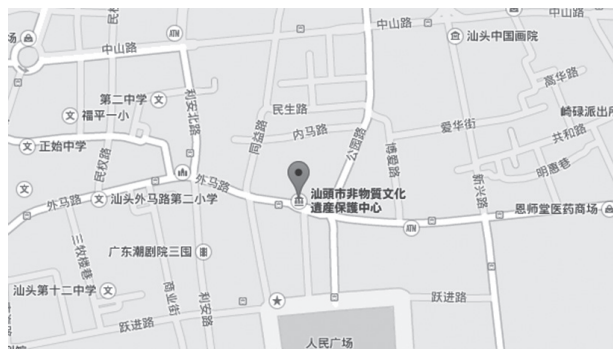
図2 汕頭市非物質文化遺産保護センター地図 (Google Map)