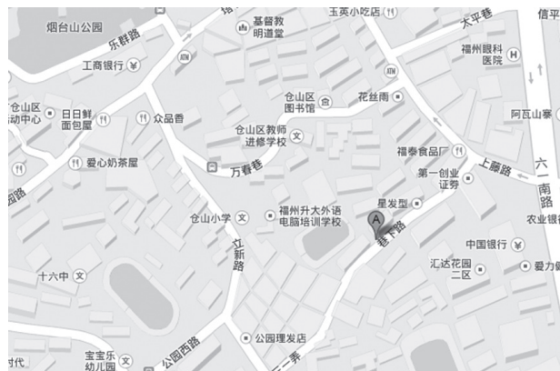
図6 福州市倉山小学辺地図（Google Map）

その辺りは現在「福州市倉山区」に相当し、倉山小学の住所は福建省福州市倉山区立新路25である（図6）。